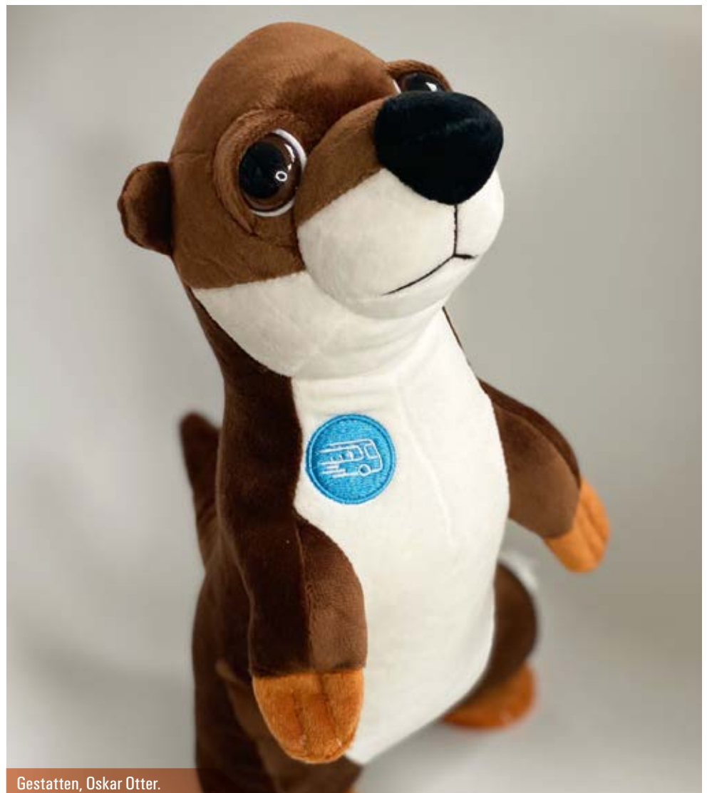
Gestatten, Oskar Otter.

Ganz genau ist noch nicht klar, was Oskar Otter den Leserinnen und Lesern, vor allem den Kindern, so einflüstern wird. Er wird unerkannt in den Linienbussen im Wartburgkreis mitfahren, zuhören, was so erzählt wird, hinschauen, was so passiert. Er wird als Oberlehrer gute Ratschläge geben und als Oberschlaumeier ablästern und pointiert kommentieren. Oskar Otter taucht in der Zeitung auf und ab, wie im Tier-